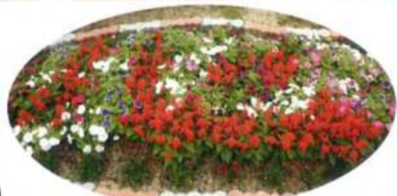
5/27 ボランティア養成講座でガーデニング講座を 行い、“心”のこもったかわいい花壇ができあがりました。 社協会館横