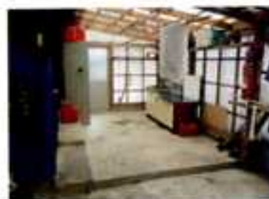
←すっきり片付けました