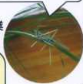
福祉保健センター、社協会館周辺の除草作業